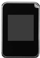
① デジタルフォトフレーム本体

このたびは、デジタルフォトフレーム「400-DFP006BK」をお買い上げいただき誠にありがとうございます。ご使用前にパッケージに入っているセット内容をお確かめください。製品内容は以下の通りです。