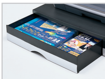
A4用紙+ハガキ用紙収納可能