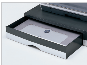
A4ノートパソコン収納可能