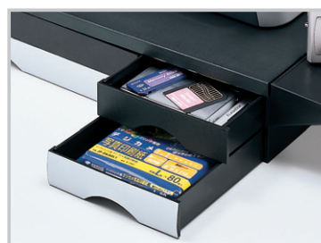
写真用紙、小物収納可能

デジカメスタンド付きなので、プリンタに直結して印刷する時もデジカメの置き場に困りません。