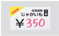
油性ペンやボールペン、鉛筆でも書ける。

※用紙は完全耐水ではありません。水につけたり、雨さらしにした際は、切断部より水がしみ込むことがあります。野外環境で使用する場合は約2~3日くらいを目安にしてください。