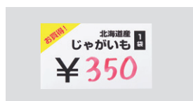
油性ペンやボールペン、鉛筆でも書ける。