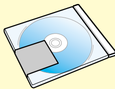
CD・DVDなどの開封確認用に