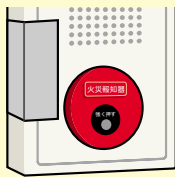
火災報知器などの防災設備に貼っていたずら防止に