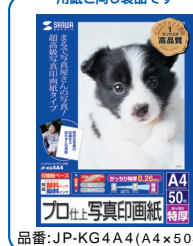
品番: JP-KG4A4 (A4×50枚)