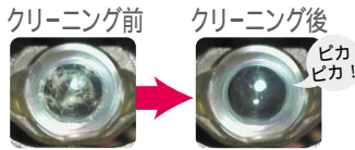
ピックアップレンズ拡大図

湿式ワイドブラシがピックアップレンズに付いたホコリや汚れを強力に取り除き、よりクリアな画像と音声を再生します。