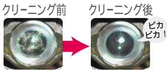
ピックアップレンズ拡大図

ピックアップレンズに付いたホコリや汚れを取り除き、よりクリアな画像と音声を再生します。 また、導電性繊維サンダーロン®が静電気を取り除きホコリの再付着を防ぎます。