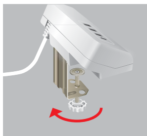
① クランプのつまみを矢印の方向に回して広げます。