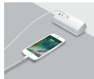
② 接続機器に対応したUSBケーブルを本製品に接続して充電してください。充電が完了したらUSBケーブルを本製品から取外します。