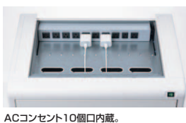
ACコンセント10個口内蔵。