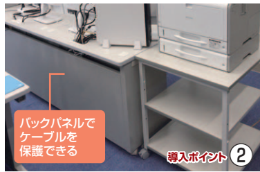
バックパネルでケーブルを保護できる