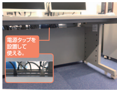
電源タップを設置して使える。