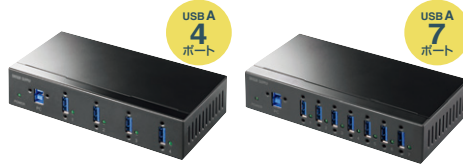
USB-3HFA04 ¥25,000 (税抜価格)