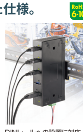
DINレールへの設置に対応。

■サイズ・重量:約W158×D80×H32mm・約383(389)g ※( )はUSB-3HFA07