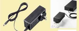
USB-AC2 ¥6,500 (税抜価格)