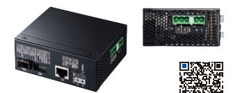
LAN-NGC240 ¥65,300 (税抜価格)