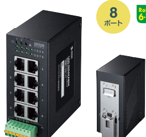
LAN-GIGAF804 ¥55,000 (税抜価格)