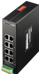
LAN-GIGAPOEFA84 ¥120,000 (税抜価格)