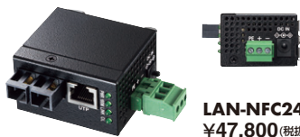
LAN-NFC241 ¥47,800 (税抜価格)