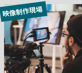
映像制作現場 カメラからの映像が途絶えてしまい、重要なシーンが録画できない…。