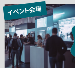
イベント会場 デジタルサイネージが突然黒画面になる…。