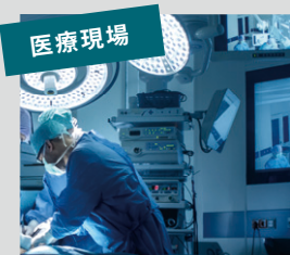
医療現場 モニターが切断され、手術に支障をきたす可能性が…。