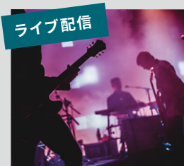
ライブ配信 複数の機器どれか1つが外れると配信が途絶えてしまう…。