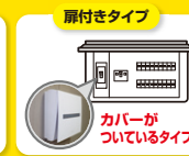
感震ブレーカーアダプターYAMORI