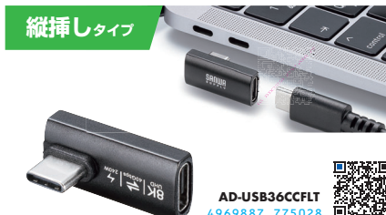
AD-USB36CCFLT 4969887 775028