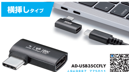
AD-USB35CCFLY 4969887 775011