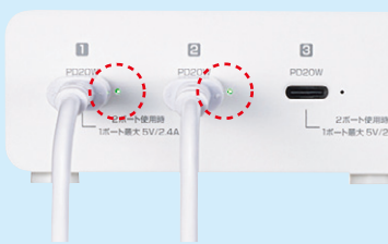
ポート毎の充電状態を確認することができる。