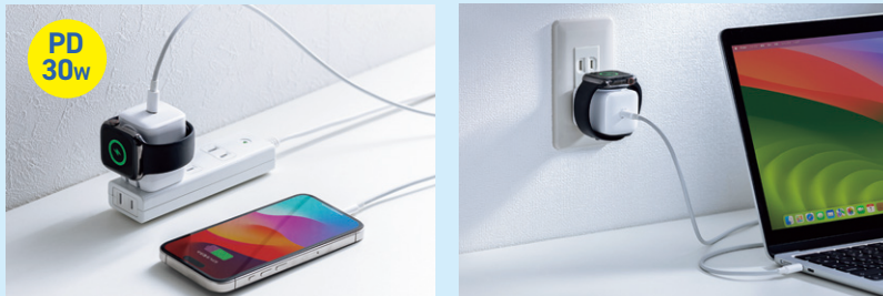
USB PD規格の最大30Wに対応し、iPhone、iPad、13インチMacbook AirなどとApple Watchを同時に充電できる。

タブレット、スマートフォンなどを最大6台まとめて充電できる。PD20Wの出力に対応。