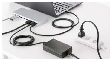
ドッキングステーションやドッキングハブを接続したノートパソコンにも安定して給電できる、高出力の100Wに対応。