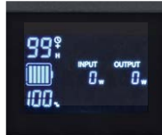
使用状況ひと目でわかる表示パネル。リン酸鉄リチウムイオン電池採用。