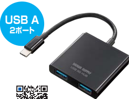
USB A 2ポート, USB-3TCP9BK 4969887 783207

Windows 11 10 macOS Chrome Android iPadOS iOS ※1: Chrome OSの対応は弊社WEB対応表をご覧ください。