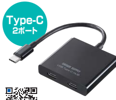
Type-C 2ポート, USB-3TCP12BK 4969887 783412