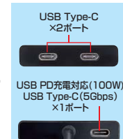
USB Type-C ×2ポート, USB PD充電対応(100W) USB Type-C (5Gbps) ×1ポート