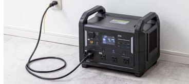
家庭用コンセントに直接挿して約2時間で満充電できる急速充電機能と、充電しながら給電できるパススルー機能付き。