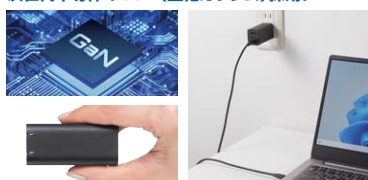
次世代半導体のGaN(窒化ガリウム)を採用し、高出力でありながら発熱を抑え、軽量小型化を実現。