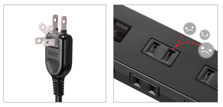
絶縁キャップ付きシングプラグ。ホコリ防止シャッター付き。