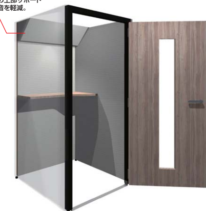
東京鋼鐵工業株式会社

特殊な調音材「オーラルソニック」を使用! 周囲の雑音を軽減し集中力を高めてくれるワークボックス