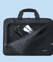
大型フロントポケットには アダプタやマウスを収納可能。