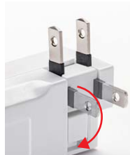
180°スイングの収納プラグ。