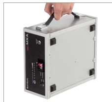
持ち運べるハンドル付き。