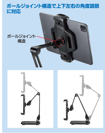
ボールジョイント 構造