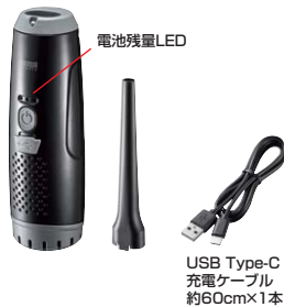
USB Type-C 充電ケーブル 約60cm×1本