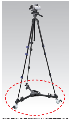
お手持ちの三脚に後から装着できる、キャスター付き三脚台。