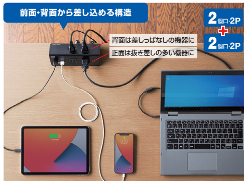
前面・背面から差し込める構造