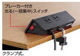
プレーカー付き 光る(一括集中)スイッチ