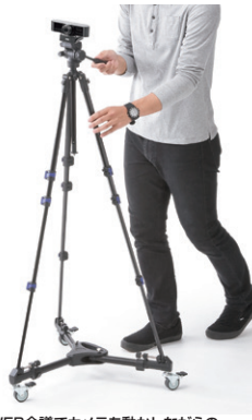
WEB会議でカメラを動かしながらの撮影に便利。