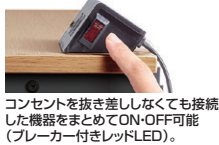
コンセントを抜き差ししなくても接続した機器をまとめてON-OFF可能(プレーカー付きLED)。