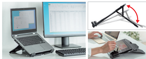
タイピングや動画視聴など、用途に合わせて角度を調整。