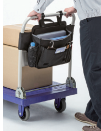
台車のハンドルスペースを有効活用。