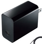
USB Type-Cケーブル(約1.5m) 4969887 505731