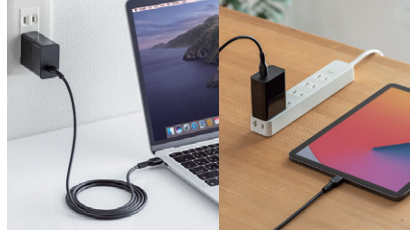
Type-Cポートを搭載したノートパソコン、スマートフォン、タブレットまで1台で充電可能。