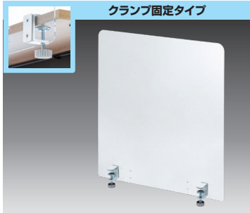
クランプ固定タイプ