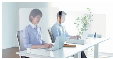
SPT-DPHT60CL 4969887 621196