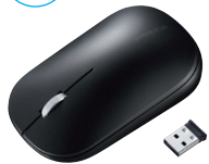
MA-WBLS174BK(ブラック) 4969887 697665