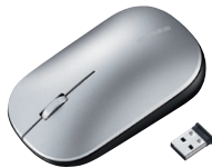
MA-WBLS174S(シルバー) 4969887 697672