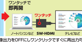
ワンタッチで即再開