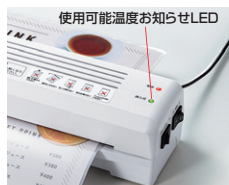
使用可能温度お知らせLED