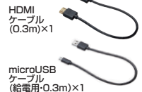
HDMIケーブル(0.3m)×1 microUSBケーブル(給電用・0.3m)×1