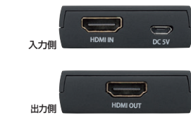
入力側 HDMI IN DC 5V 出力側 HDMI OUT