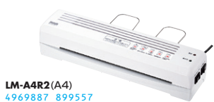
LM-A4R2 (A4) 4969887 899557