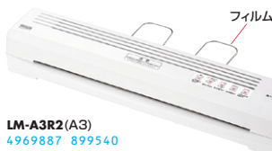
LM-A3R2 (A3) 4969887 899540