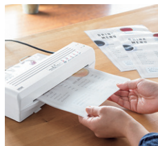
ホットラミネーターとコールドラミネーターが両方できる。