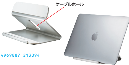
ノートパソコンを置く。