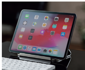
ベゼルが狭い機種でも使いやすいデザイン。