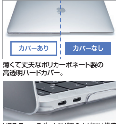
USB Type-Cポートなどをふさがない構造。