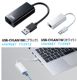
USB-CVLAN1BK(ブラック) USB-CVLAN1W(ホワイト) 4969887 753972 4969887 753989

USB3.1 Gen1 (USB3.0) - LAN USB Type-C - LAN