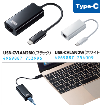
USB-CVLAN2BK(ブラック) USB-CVLAN2W(ホワイト) 4969887 753996 4969887 754009