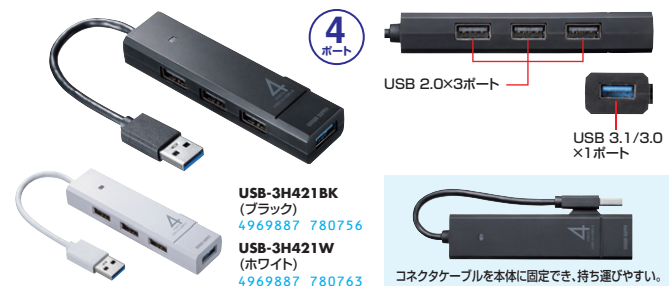
4969887 780756 USB-3H421BK (ブラック) 4969887 780756 USB-3H421W (ホワイト) 4969887 780763