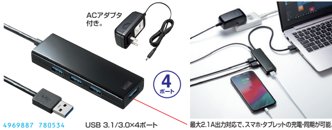
4969887 780534 USB 3.1/3.0×4ポート 最大2.1A出力対応で、スマホ・タブレットの充電・同期が可能。