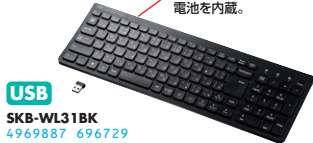
USB SKB-WL31BK 4969887 696729