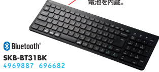
Bluetooth SKB-BT31BK 4969887 696682