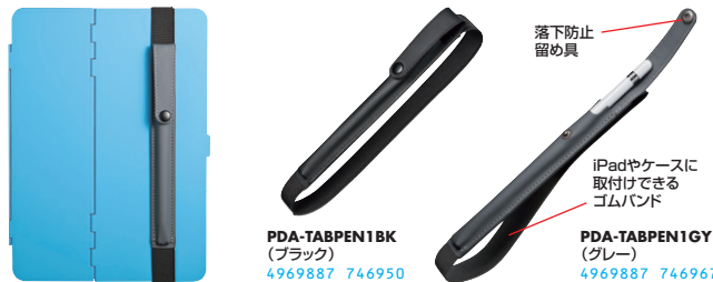
PDA-TABPEN1BK (ブラック) 4969887 746950 PDA-TABPEN1GY (ブルー) 4969887 746967

PDA-TABPEN1シリーズ Apple Pencil収納ケース 各¥2,200 (税抜価格)