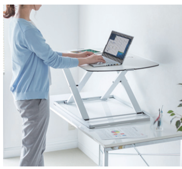
既存のデスクに置くだけで、上下昇降機能を追加できる。1日の中で立ち作業、座り作業の時間を作ることで、疲労を軽減。