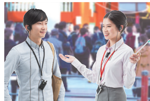
1台の親機に対し複数台の子機が使ってツアーガイドや工場見学に最適。