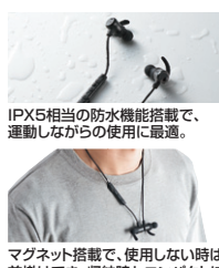
IPX5相当の防水機能搭載で、運動しながらの使用に最適。 マグネット搭載で、使用しない時は首掛けでき、収納時もコンパクトにまとめることができます。